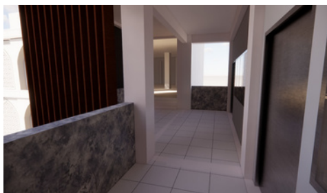
*Desain Rencana Bangunan