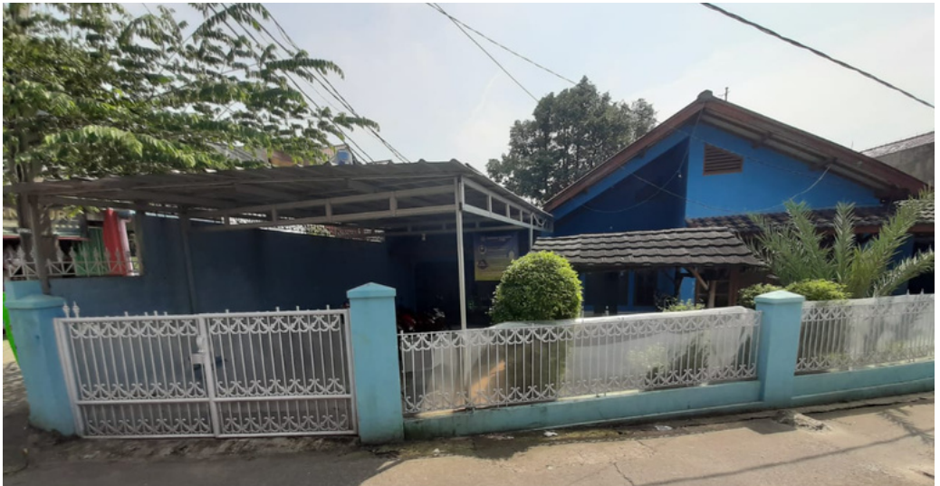
*Foto Bangunan yang Disewa Sekarang