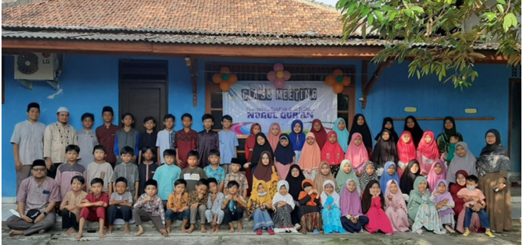
*Foto Santri & Guru Pesantren Tahfiz & Tafhim Nurul Qur'an